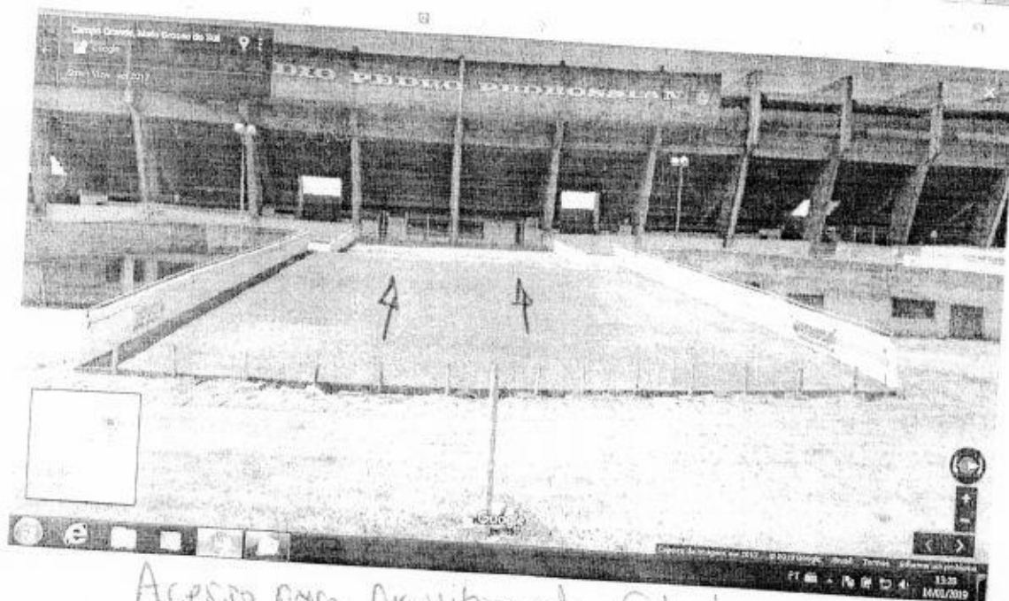
Acesso para Arquibancada Coberto