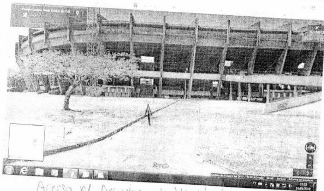
Acesso p/ Arquibancada Visitante

A handwritten signature or mark, possibly a stylized 'L' or 'J', located in the bottom right corner of the page.