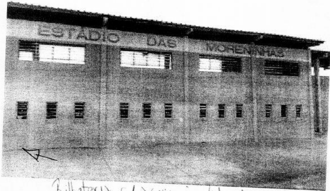
Bilheteria el acceso ao lateral